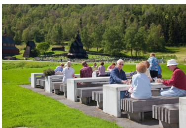
Kafé ved Borgund stavkyrkje besøksenter.