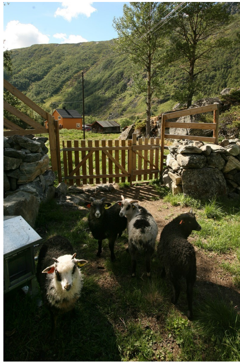
Kanskje møter du lam på veg inn til Gram.