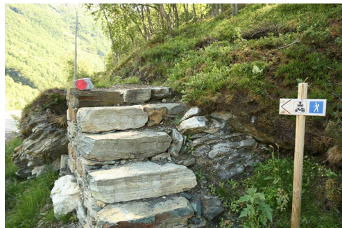
Trapp etter at du har kryssa Brattebakken bru og gamle E16 og skal opp mot Raudgalden.