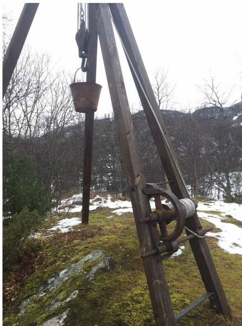
Gammalt utstyr langs kongevegen under Maristova.