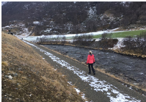
Turvegen går eit lite stykke langs elva, på vegkroppen til nye E16.