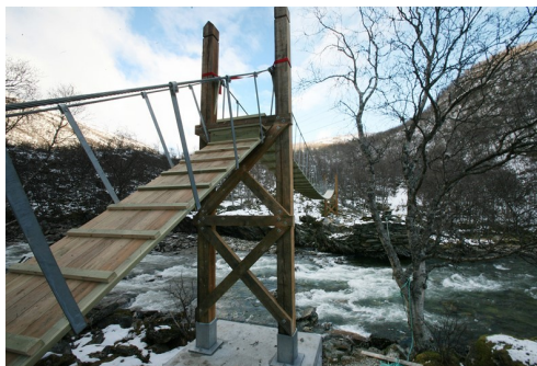
Hengebrua Brattebakken bru er bygd etter inspirasjon av dei gamle kongevegbruaene.