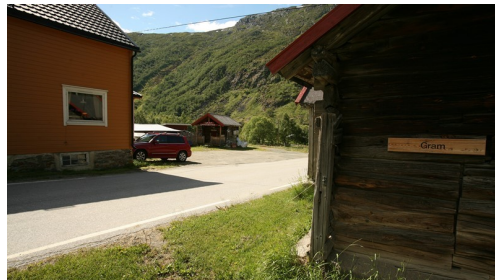
Vandreruta går gjennom grunder og inn på tunet her på Gram.