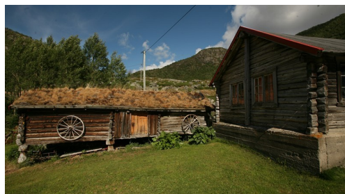
Gram. Stabburet vart flytta hit 1870/80-åra.