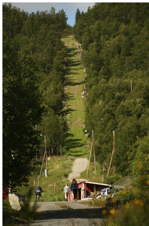
Jakobstigen er den første av «Dei sju skuffetsar».

Den opphavelige Brattebakken bru var Vestlandets einaste utleggsbru. Bygginga