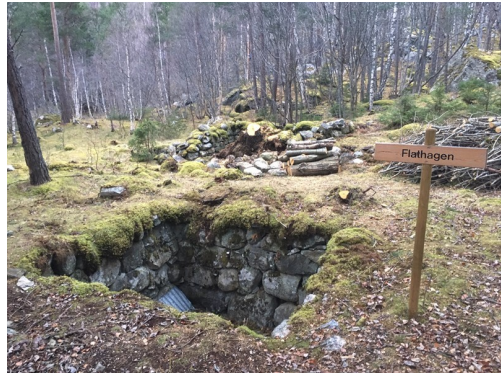
Ruinane etter husmannsplassen Flathagen.