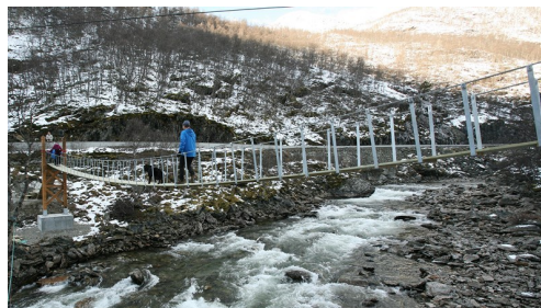
Brattebakken bru tar deg over Smedøla.