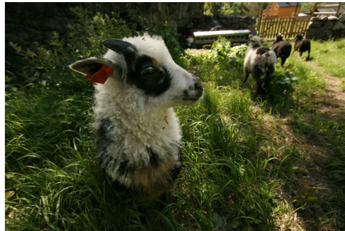
Lamma er nysgjerrige på kongevegvandrarane.