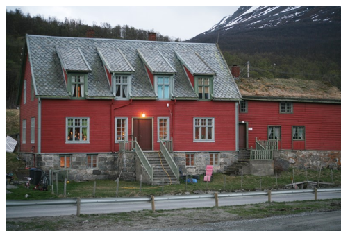
Maristova. Margretestuen til høgre.