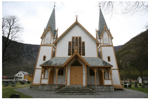
Hauge kyrkje på Lærdalsøyri med sine karakteristiske to tårn.