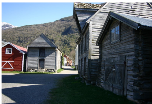
Løytnantsbryggja. Her startar/endar kongevegen. Jektehamna på gamle Lærdalsøyri var ein av dei travlaste på nordvestlandet i si tid.