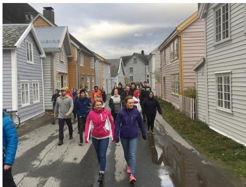
Kongevegen over Filefjell går gjennom hovudgata på gamle Lærdalsøyri og ned til den gamle jektehamna.