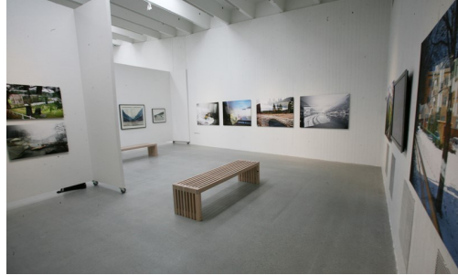
Sogn kunstsenter ligg på Lærdalsøyri.