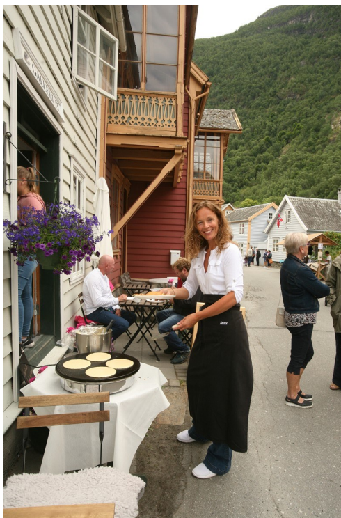
Du finn koselege småkafear på gamle Lærdalsøyri.