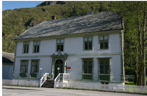
Den gamle Telegrafan. I første høgda finn du post- og telemuseum.