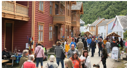
Lærdalsmarknaden blir framleis arrangert på gamle Lærdalsøyri, den tredje helga i juni kvart år.

Heile delstrekninga Lærdalsøyri-Ljøsnestien går på asfalt. Den autentiske kongevegen ligg i stor grad under dagens E16 og Rv. 5.