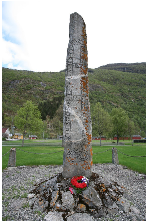
Bauta til minne om Lærdalskompaniet som slost ei rekke slag og trefningar mot svenskane under Napoleonskrigane.