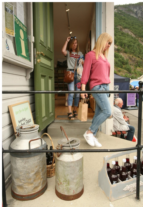
Det er i dag små, koselege butikkar i krambuene frå 1800-talet.

Besøk gjerne post- og telemuseet (Øyragata 44a) som syner kva knutepunkt Lærdalsøyri vart også innan post og telekommunikasjon.