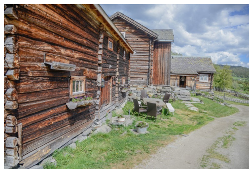
Sørre Hemsing like ved ruta er kjent for god mat.