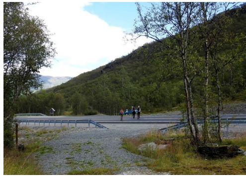
Pass på når du kryssar E16 ved Varpe bru.