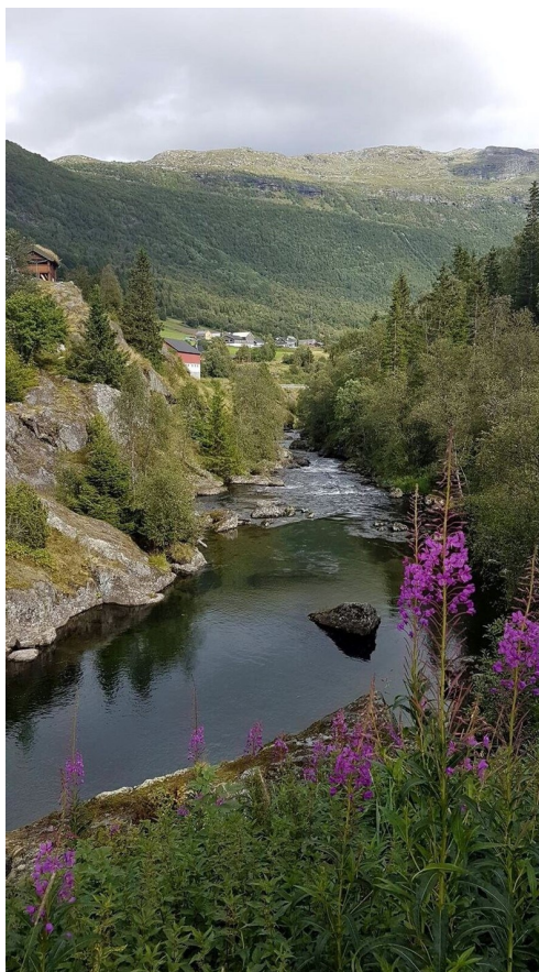
Utsyn over Begna nedanfor Olshølbrue.