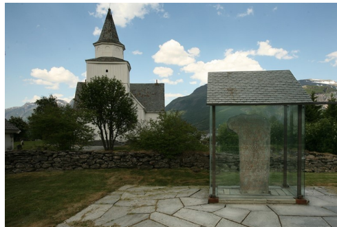
Vangsteinen står til høgre for inngangen til Vang kyrkje.

Steinen sto inntil 1840-tallet utanfor Vang stavkyrkje. Då kyrkja vart reven og flytta til Karpacz i Polen, vart steinen flytta til kyrkegardsporten ved Vang kyrkje, der den står framleis.