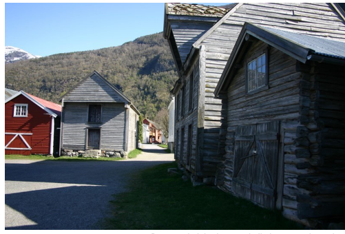
Den gamle jektehamna, kalla Løytnantsbryggja.