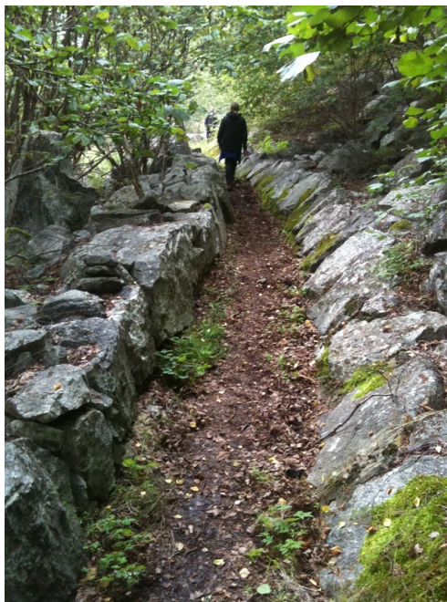
Ljøsnaveti frå 1890-åra.