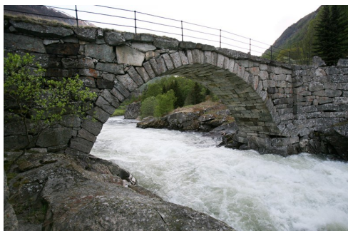
Steinkvelvingsbrua Nedre Kvame bru ser du like bortanfor der Øygardsvegen tek av frå gamle E16.