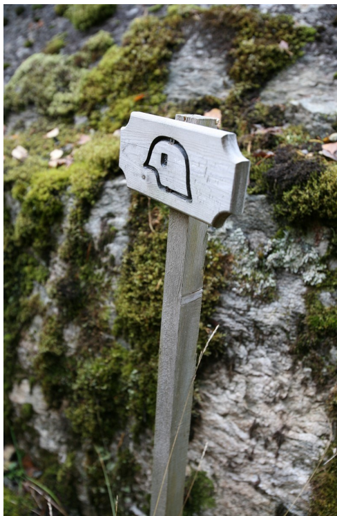
Ser du dette skiltet er det tyske krigsminne i området.

På Ljøsne ser du difor ulike former for kunstig vatning, som til dømes vasspredarar. Men tidlegare var sokalla vatningsveiter viktig. Denne kulturminnetypen finn du ikkje mange plassar, men for det nedbørsfattige, og samtidige grøderike jordbrukslandet på Ljøsne var veitene livsviktig.