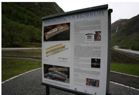
Les om vikinglandsbyen på Bjørkum.