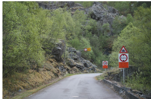
Gamle E16 gjennom Steineåsen og Seltunåsen er freda, både veg og skilt.