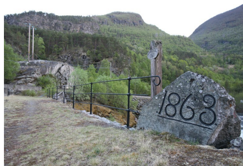
Nedre Kvame bru erstatta Steine bru tre år etter storflaumen. Brua vart bygd 2 km. lenger oppe i dalen.