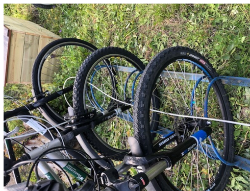
Sørg for at låsevaieren er innom alle syklane