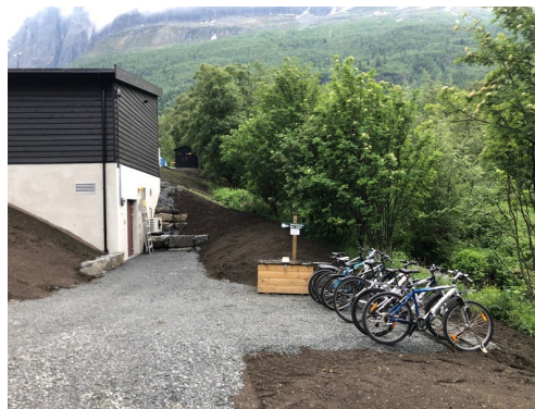
Sykelstasjon «Øye stavkyrkje»