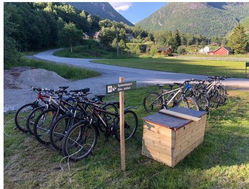
Sykkelstasjon Borgund sentrum

NB: Syklane skal ikkje nyttast på dei verna delstrekningane. Sykkeltilbodet er meint for deg som vil sykle grus- og asfaltstrekningane eller utforske Øye, Vang, Borgund og Lærdal frå sykkelsetet.